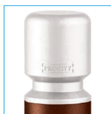
Système d'amovibilité pour potelets Serrubloc® 21