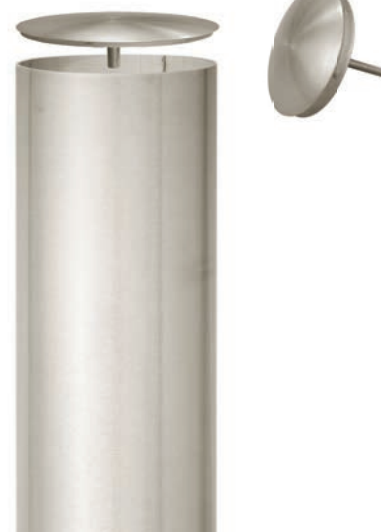
Version anti bélière tête avec tige pour remplissage béton