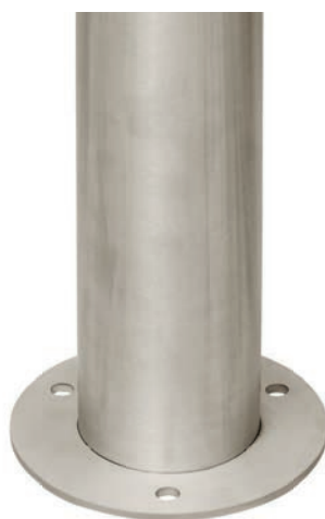
Fixation sur platine